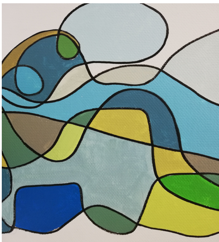
Extrait de peinture murale réalisée par Nelly Nahon au CATTP de l'hôpital R. Ballanger à Aulnay sous Bois

Seront abordées au cours de l'après-midi les différentes pratiques soignantes quotidiennes en service de pédopsychiatrie pour les enfants avec TSA, en dehors des situations d'urgence et d'évaluation afin de mettre en valeur le travail au long cours des équipes dans sa dimension thérapeutique.